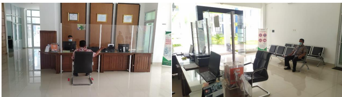
Gambar 1. Ruang Pelayanan Publik / Informasi

Saat ini ruangan dan meja untuk layanan informasi publik di Baristand Industri Manado masih digabung dengan layanan jasa (meja registrasi) yang berada di ruang depan Kantor Baristand Industri Manado Jl. Raya Mapanget, Kel. Paniki Dua, Kec. Mapanget, Manado yang dilengkapi dengan meja, kursi, telepon, perangkat komputer dengan fasilitas internet, printer, dan kotak saran. Baristand Industri Manado telah membangun dan mengembangkan sistem layanan informasi publik melalui website Baristand Industri Manado yang Beralamat di http://baristandmanado.kemenperin.go.id yang telah dikembangkan muatan informasinya sesuai amanat UU KIP.